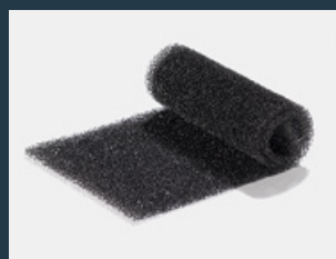
Oryginalne maty filtracyjne MAN