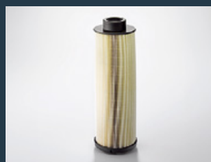
Oryginalne filtry paliwa MAN