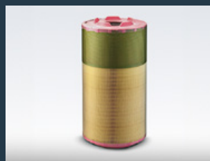
Oryginalne filtry powietrza MAN