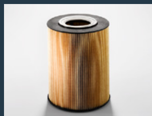
Oryginalne filtry oleju silnikowego MAN