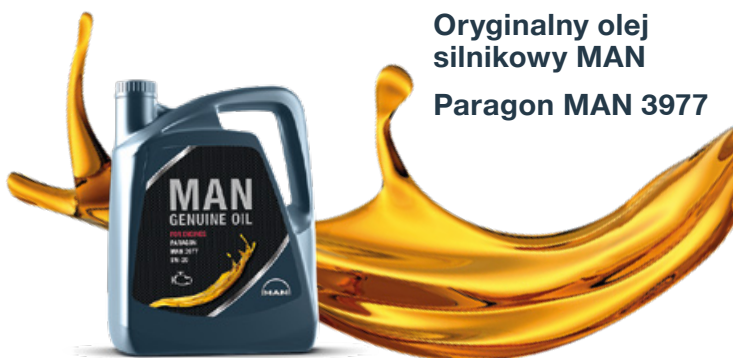
Oryginalny olej silnikowy MAN Paragon MAN 3977

Wybierz olej silnikowy, który pozwoli Ci lepiej wykorzystać paliwo. Dzięki niskiej lepkości 5W-20, Paragon MAN 3977 może zmniejszyć zużycie paliwa. To się opłaca już od pierwszego kilometra.